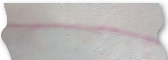
Resultat nach 3-monatiger Behandlung